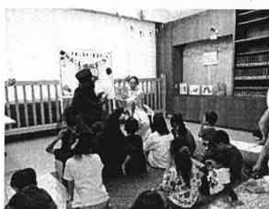
⑤-6 図書館の英語でおはなし会