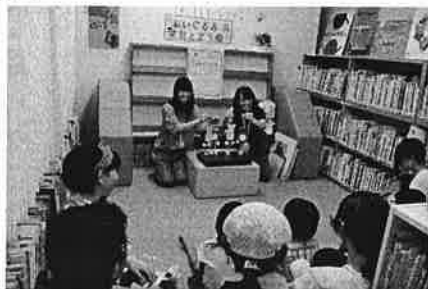
⑤-3 むいぐるみおとまり会