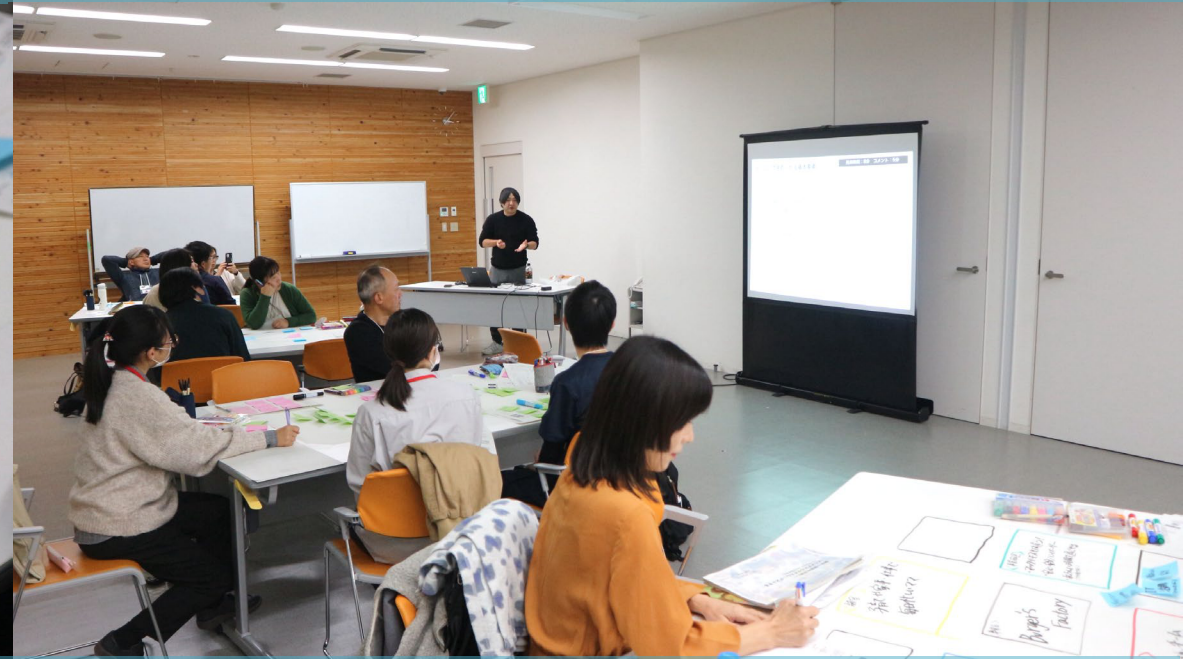
ワーク中の全体の様子