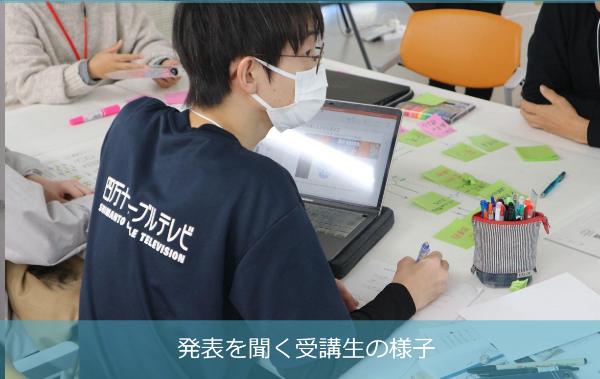
発表を聞く受講生の様子