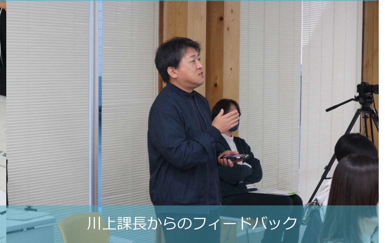
川上課長からのフィードバック