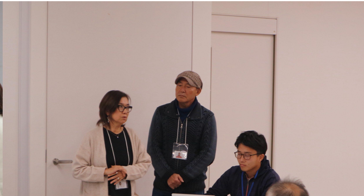
最終発表をする受講生