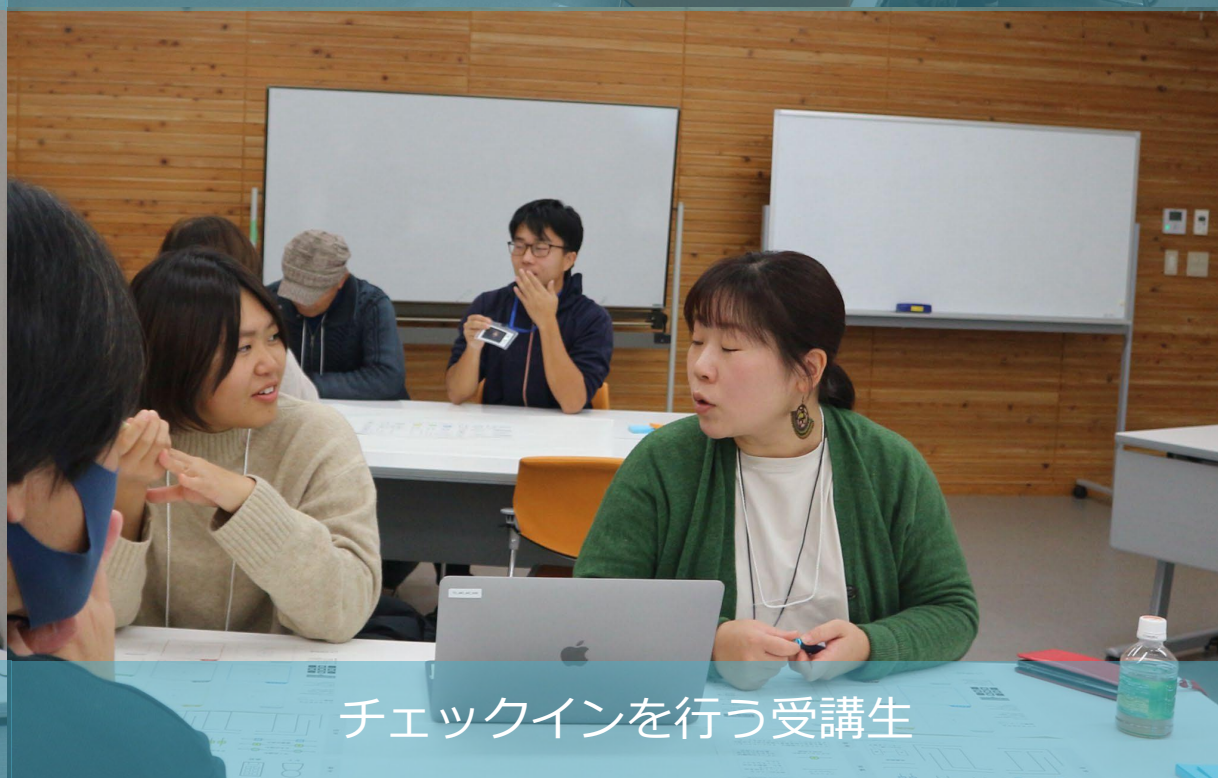
チェックインを行う受講生