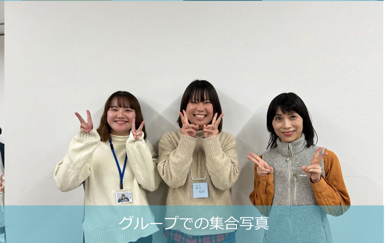
グループでの集合写真