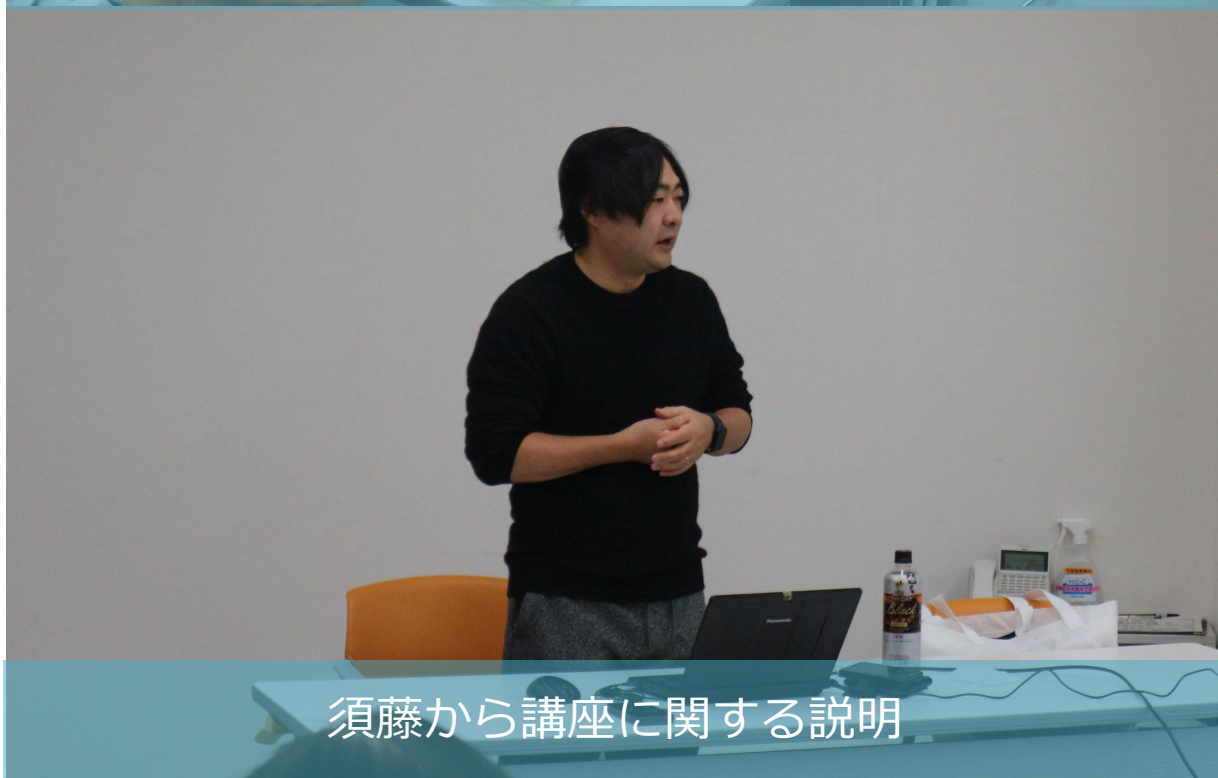
須藤から講座に関する説明