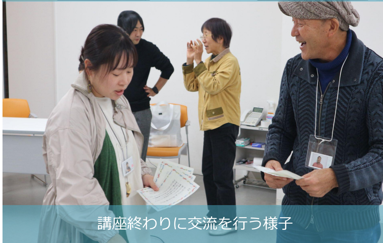
講座終わりに交流を行う様子