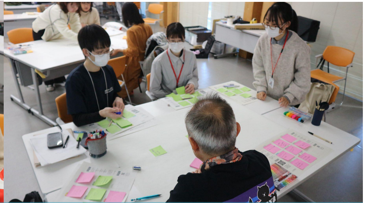
付箋を使って要素を整理