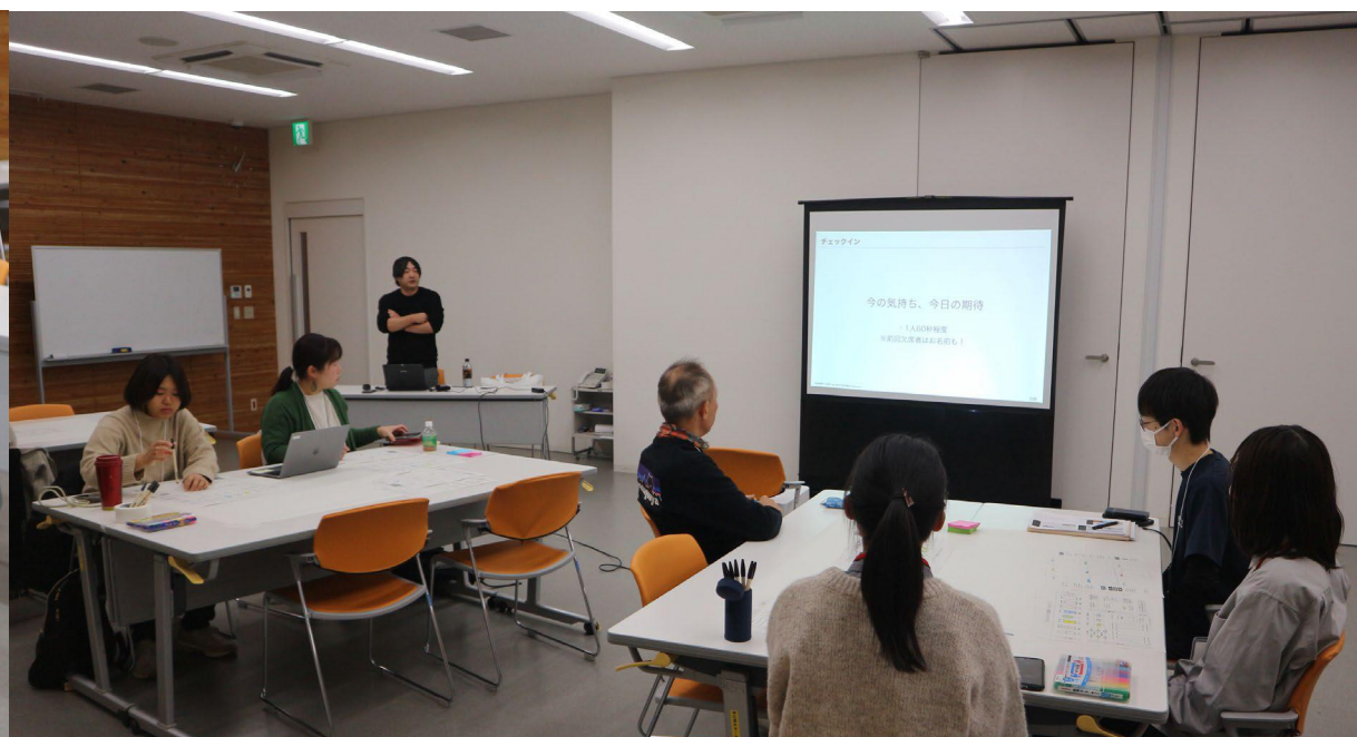
話に耳を傾ける様子