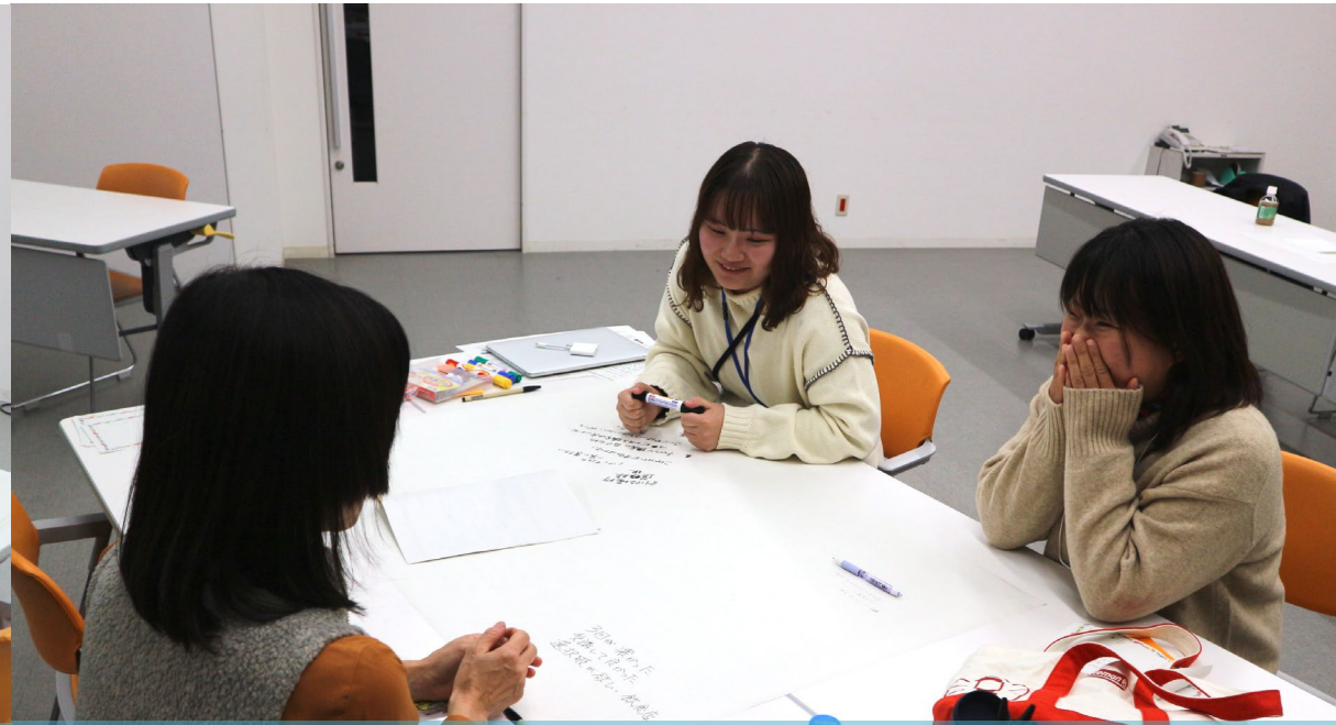
講座のまとめを行う様子