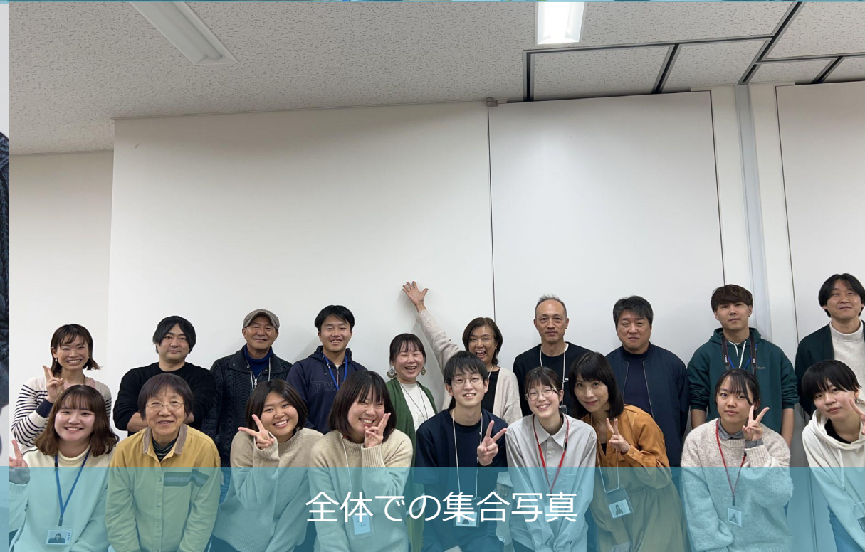
全体での集合写真