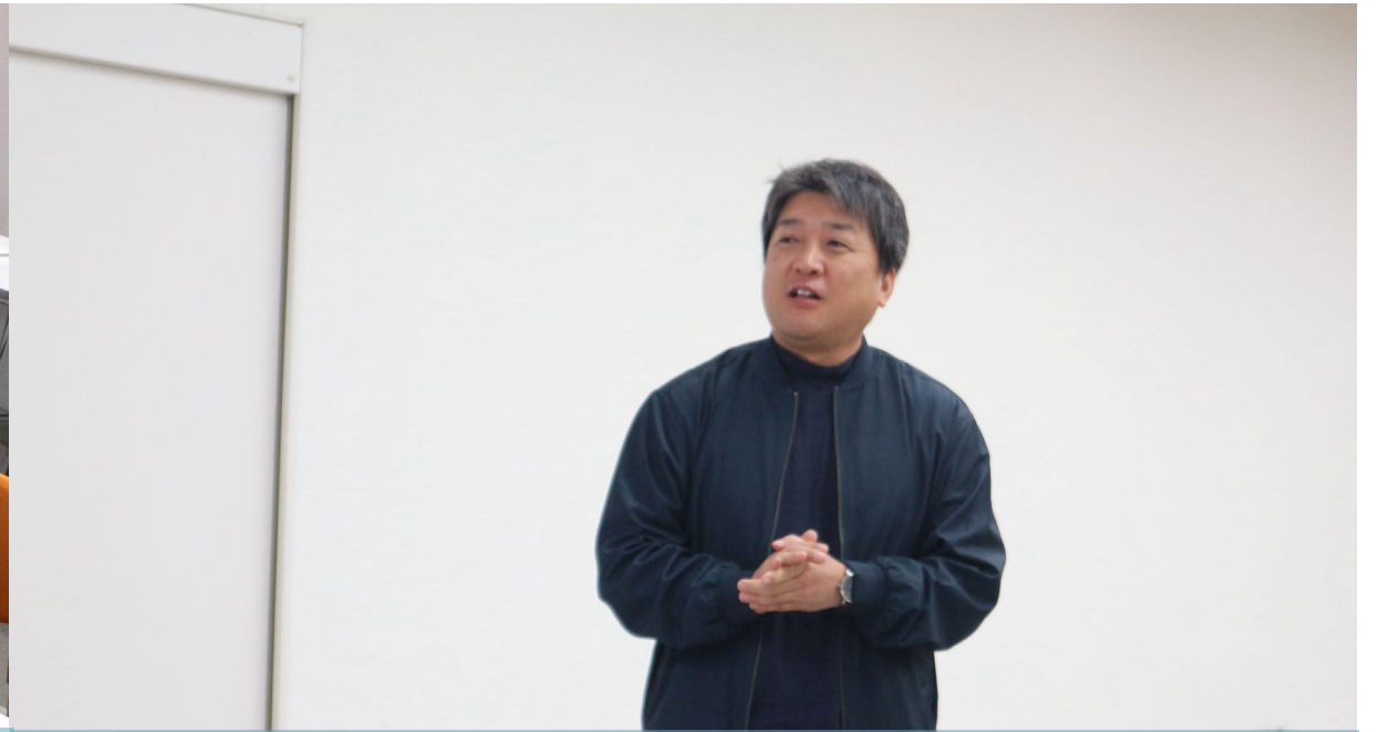
川上課長より講座の総括