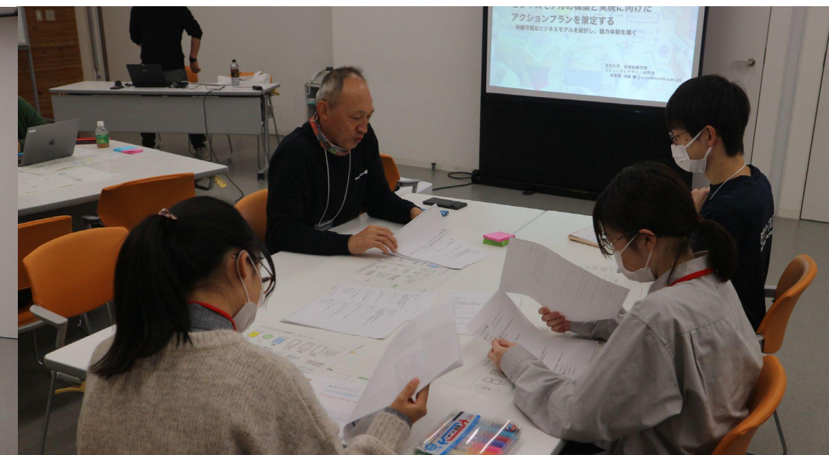
グループで前回までの振り返りを行う様子