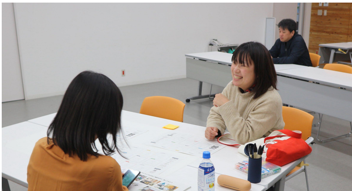
自分たちの事業について話す受講生

最初に須藤より本日の講座に関する説明が行われた後、チェックインとして「名前/今の気持ち/今日の講座への期待」についてグループ内で共有を行った。講座最終回を迎え、最終発表を控える受講生は講座が終わる寂しさを語ったり、発表に向けた不安点や構成について話し、確認する様子が見られた。「このメンバーと一緒にできてよかった」、「今まで練ってきた事業をうまく発表できるか不安」などの声が聞かれた。第一回目と比較してチームでの会話もとても弾むようになっており、和気あいあいとした明るい雰囲気最終回をスタートさせることができた。