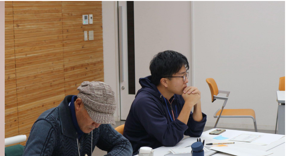
メッセージカードに記入する様子