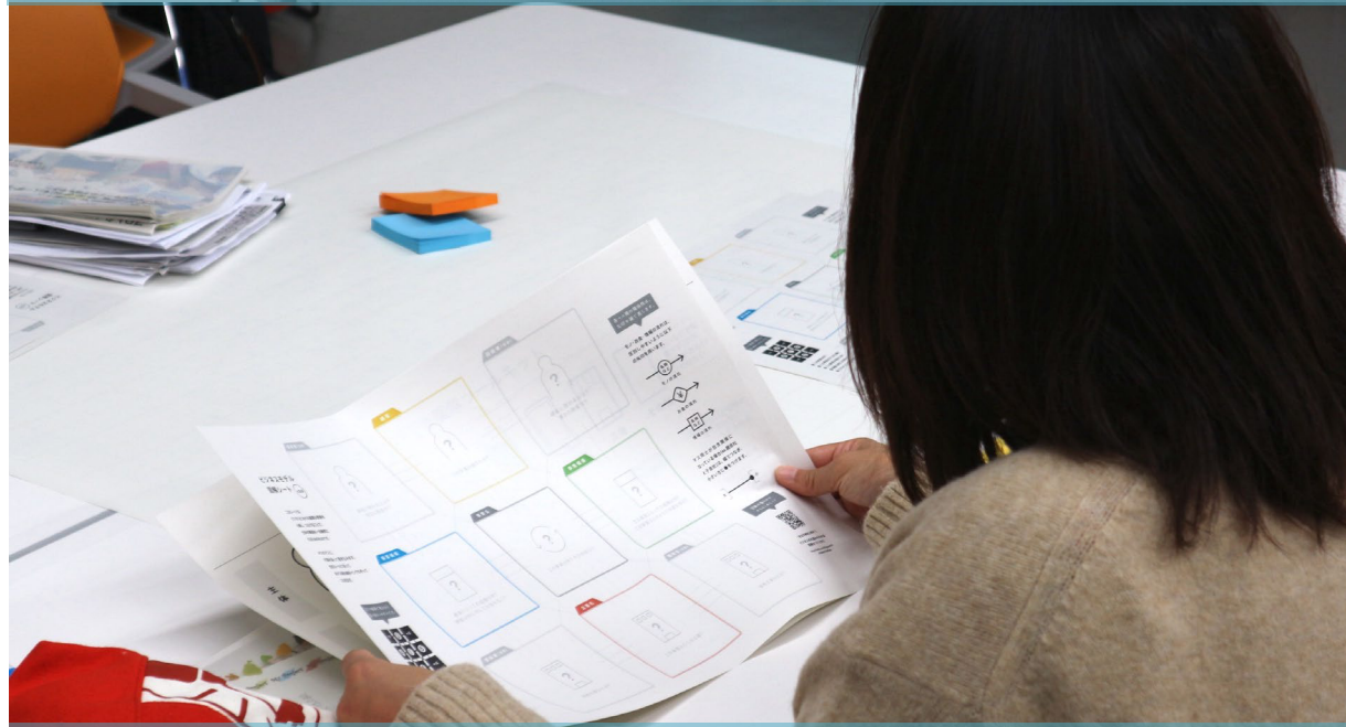
シートを眺める受講生