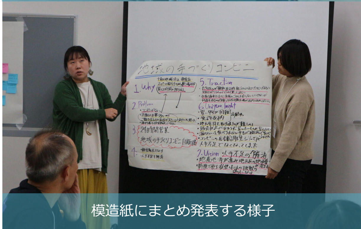
模造紙にまとめ発表する様子