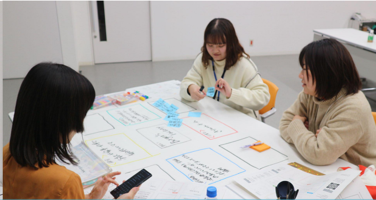
チームでまとめる様子